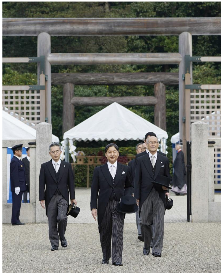
神武天皇御陵に御即位を報告された天皇陛下（令和元年11月27日）【時事】